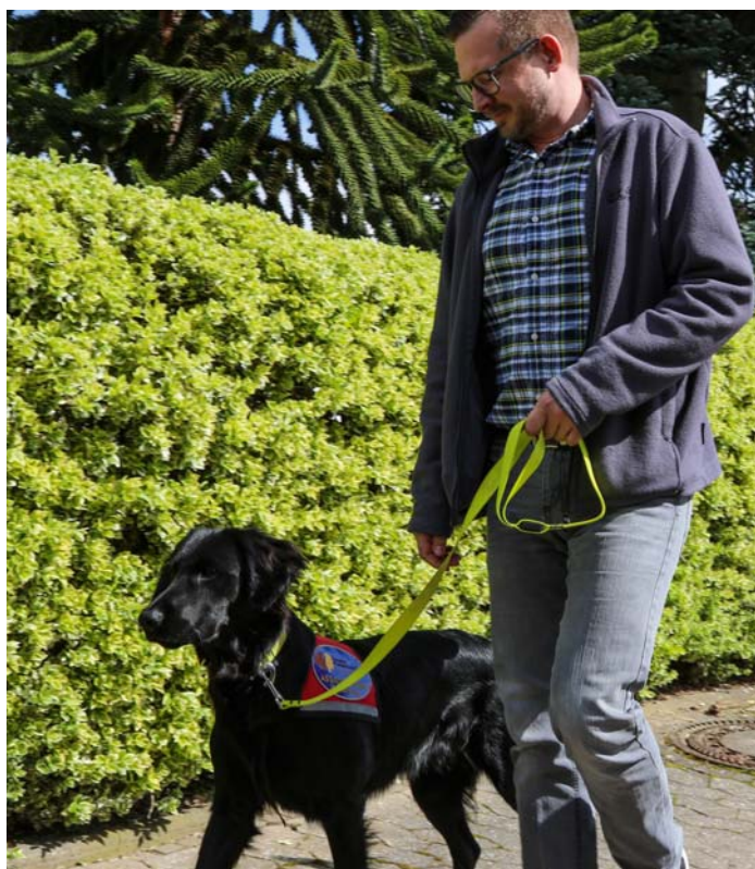
Grisu ist aufmerksam.